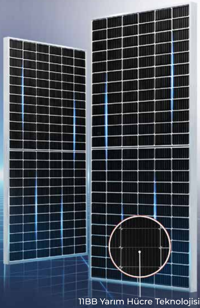
T1BB Yarım Hücre Teknolojisi

Yeni nesil M10 (182mm) mono PERC hücrelerin kullanıldığı Mavi Çam Güneş Panelleri, 11BB ve yarım hücre teknolojisi ile \text{Watt/m}^2 'de en yüksek verimi sağlayarak, çok daha düşük maliyette elektrik üretme imkanı sunar. Optimize edilmiş elektrikselsel tasarımı sayesinde daha düşük Hot Spot riski ve daha iyi bir sıcaklık katsayısı sunan Mavi Çam Güneş Panelleri, beraberinde getirdiği avantajlarla güvenli yatırım tercihiniz olacaktır.